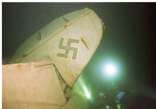
L'avion allemand gît toujours au fond du lac du Bourget. L'eau douce semble avoir préservé l'appareil. Un projet de renflouement est à l'étude.