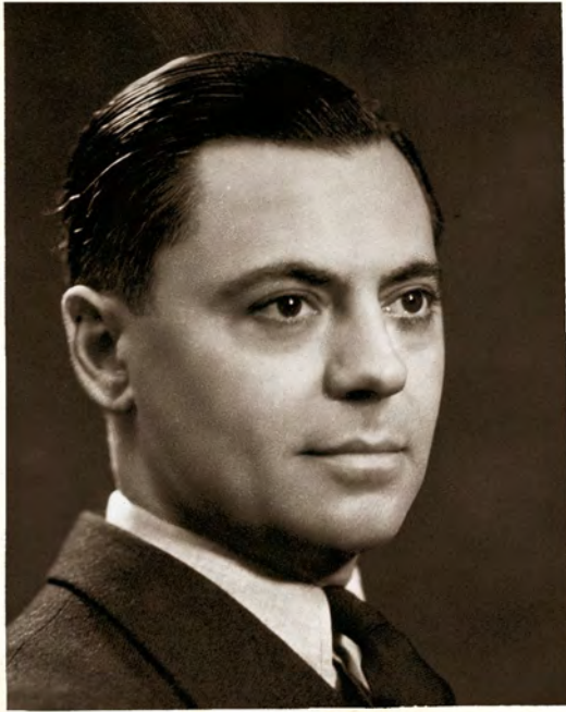
Principal artisan du CNR, Jean Moulin en a été le premier président.