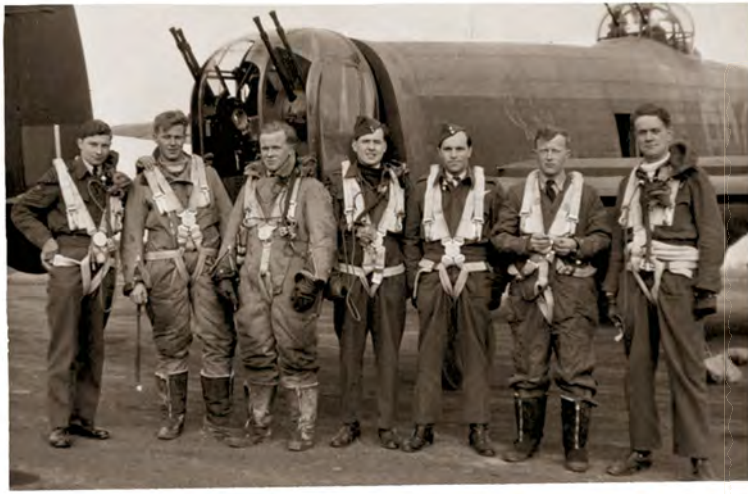
Un équipage de bombardier anglais, comme celui posant devant un Avro Lancaster, était toujours composé de sept hommes. Les appareils américains comprenaient en général un équipage de dix hommes.