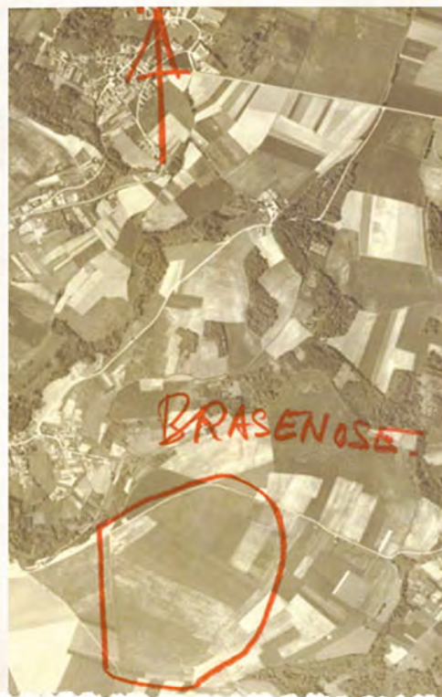
Photographie aérienne prise par un avion de reconnaissance de la RAF pour repérer un terrain d'atterrissage clandestin du réseau Passum, dans la Marne. Il porte le nom de code « Brasenose ».

Ils étaient nombreux. Le réseau Comète reliait Bruxelles à Biarritz par trains et par routes. Les Pyrénées étaient ensuite franchies à pied. D'Espagne, l'aviateur regagnait Londres ou Alger via Gibraltar. Le réseau Var opérait en Bretagne, où des vedettes rapides anglaises récupéraient les hommes dans de petites criques discrètes et les ramenaient en Angleterre. Entraide oblige, certaines de ces lignes s'interconnectaient, au détriment