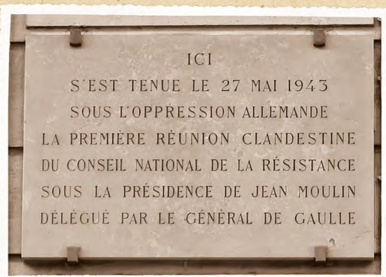
Plaque commémorative apposée sur la façade de l'immeuble situé au 48-rue du Four (Paris, 6 e ), lieu de la première réunion du CNR.