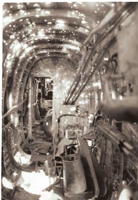
Dégâts à l'intérieur d'un bombardier anglais Handley Page Halifax causés par les éclats d'obus des canons de la Flak, la défense anti-aérienne allemande.