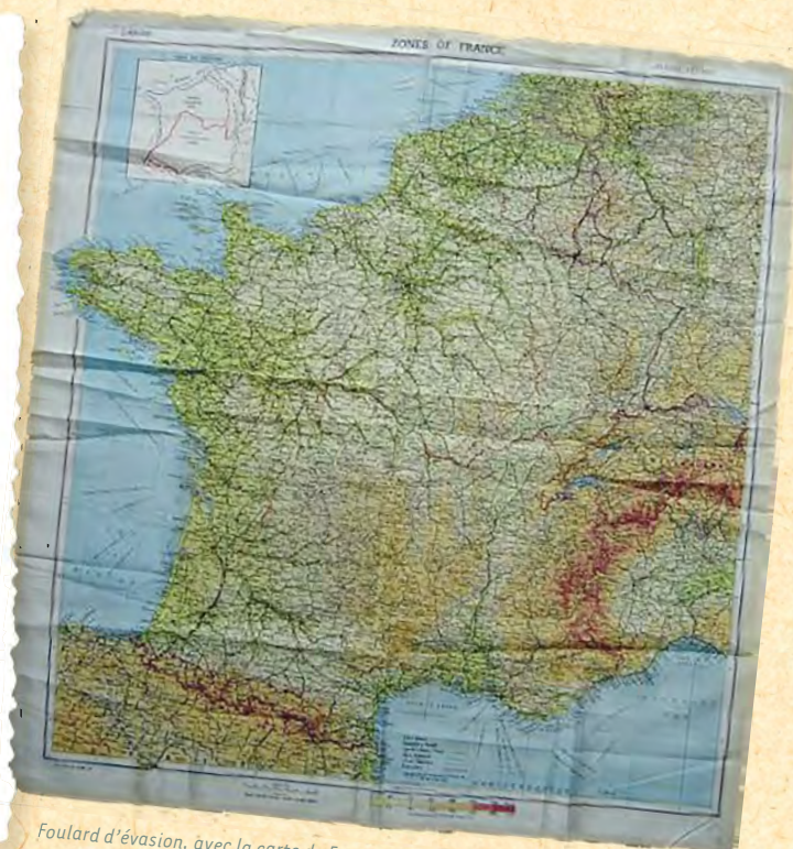
Foulard d'évasion, avec la carte de France, que portaient les aviateurs alliés.

Il ne dispose que rarement d'un revolver. Quelques rations alimentaires et une trousse médicale peuvent compléter son équipement. Un lexique multilingue tenant sur un bout de papier facilite le contact avec la population.