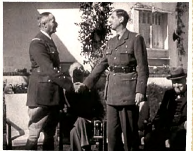
Le général de Gaulle, à droite, serre la main du général Giraud devant Roosevelt et Churchill, le 24 janvier 1943, lors d'une première tentative de rapprochement voulue par les Alliés à la conférence de Casablanca (Maroc).