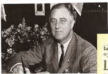
À gauche : Franklin D. Roosevelt, président des États-Unis d'Amérique. Ci-dessous à gauche : Winston Churchill, Premier ministre de l'Angleterre. Ci-dessous : Une de La Dépêche algérienne du 4 juin 1943 annonçant la création du CFLN et sa présidence à deux têtes.